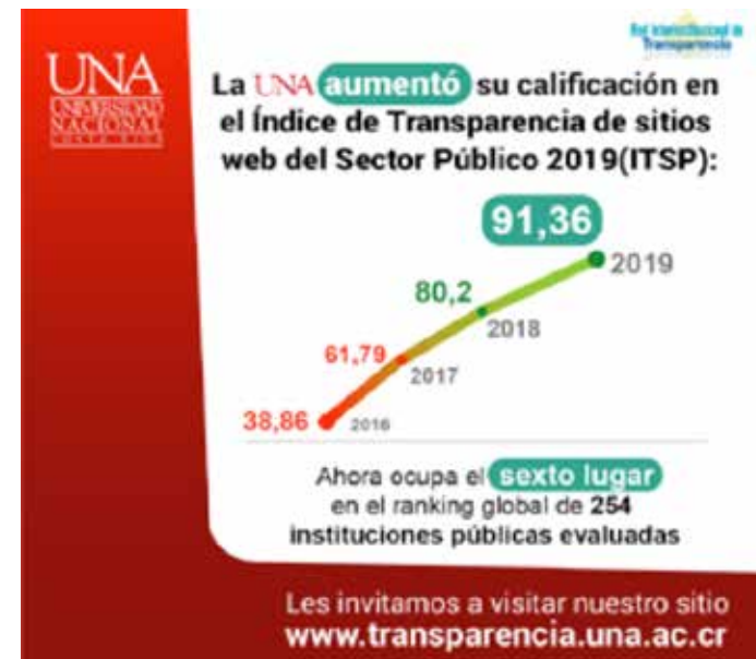
Figura No. 73. Posición Institucional en el Índice de Transparencia.

La propuesta de modelo deberá valorar las oportunidades de articulación con otros sistemas existentes en la institución, siempre en resguardo del propio modelo y consecuentes con el marco conceptual de Gobierno Abierto. La Ciga debe elaborar y presentar a la Rectoría un plan de trabajo que contemple las acciones por seguir hasta el final del primer semestre del 2021.