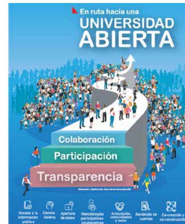
Figura No. 71. Principales Ejes de Gobierno Abierto

El tema de Gobierno Abierto, a través del tiempo ha venido dando grandes transformaciones que llevar a los países del orbe en aplicar sus teoría y hablar en el tema de un Gobierno Abierto a un Estado Abierto, en donde oriente al logro de una gobernanza colaborativa que implica la gestión hacia la apertura, la partici-