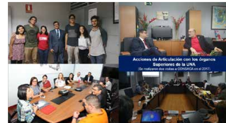
Figura No. 68. Taller de Gobierno Abierto

Como parte del proceso de concientización de los funcionarios en el mes de abril se recibe la visita del experto internacional en gobierno abierto Peter Sharp Vargas, permitiendo con ello desarrollar las siguientes actividades: