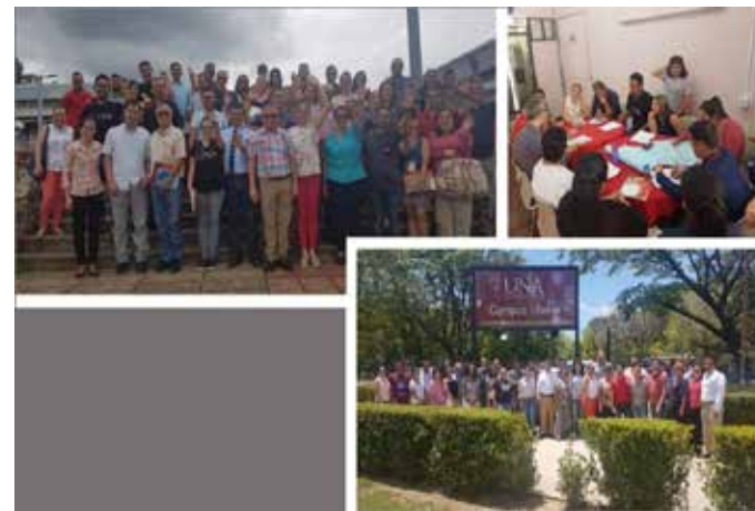
Figura No. 67. Comisión Institucional Abierto de actividades para de Gobierno

En los meses de marzo a junio, se establece el esquema del nuevo rediseño del sitio de transparencia para la próxima medición del Índice de Transparencia del Sector Público. Entre las acciones que se promovieron son las siguientes: