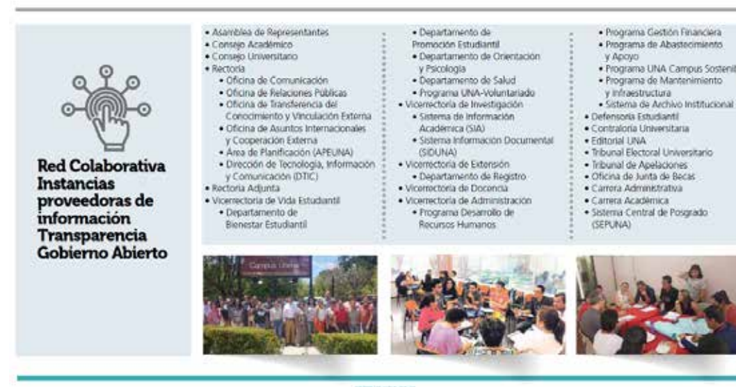
Figura No. 65. Red Colaborativa. Gobierno Abierto