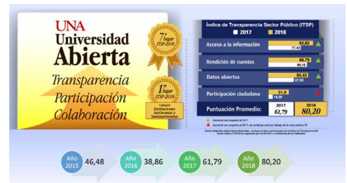
Figura No.69. Índice de Transparencia