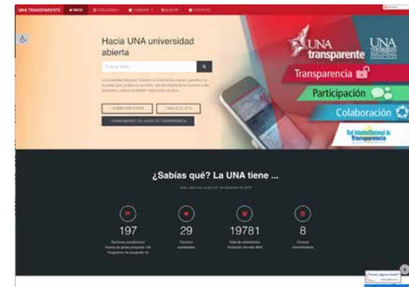
Figura No.66. Portal Una Transparente

Es así como mediante el acuerdo UNA-SCU-ACUE-1144-2017, del 2 de junio del 2017, El Consejo Universitario respaldó la incorporación de la UNA en la RIT y ratificó el interés de que la institución continúe realizando esfuerzos en procura de establecer estrategias para cumplir el principio de transparencia según lo establecido en nuestro Estatuto Orgánico.