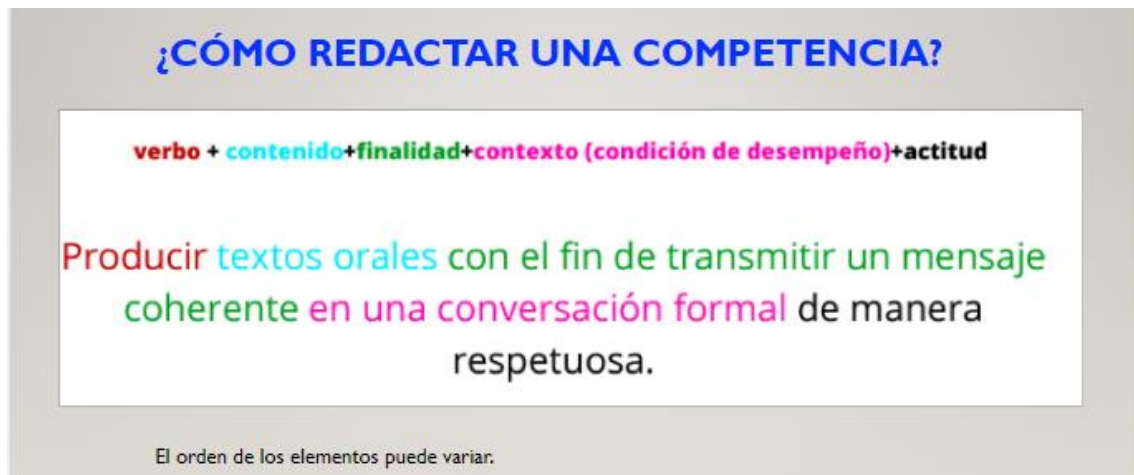
Figura 1 Estructura para la redacción de competencias específicas