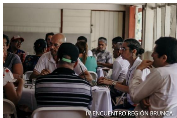
Fotos de Mesas de Diálogo