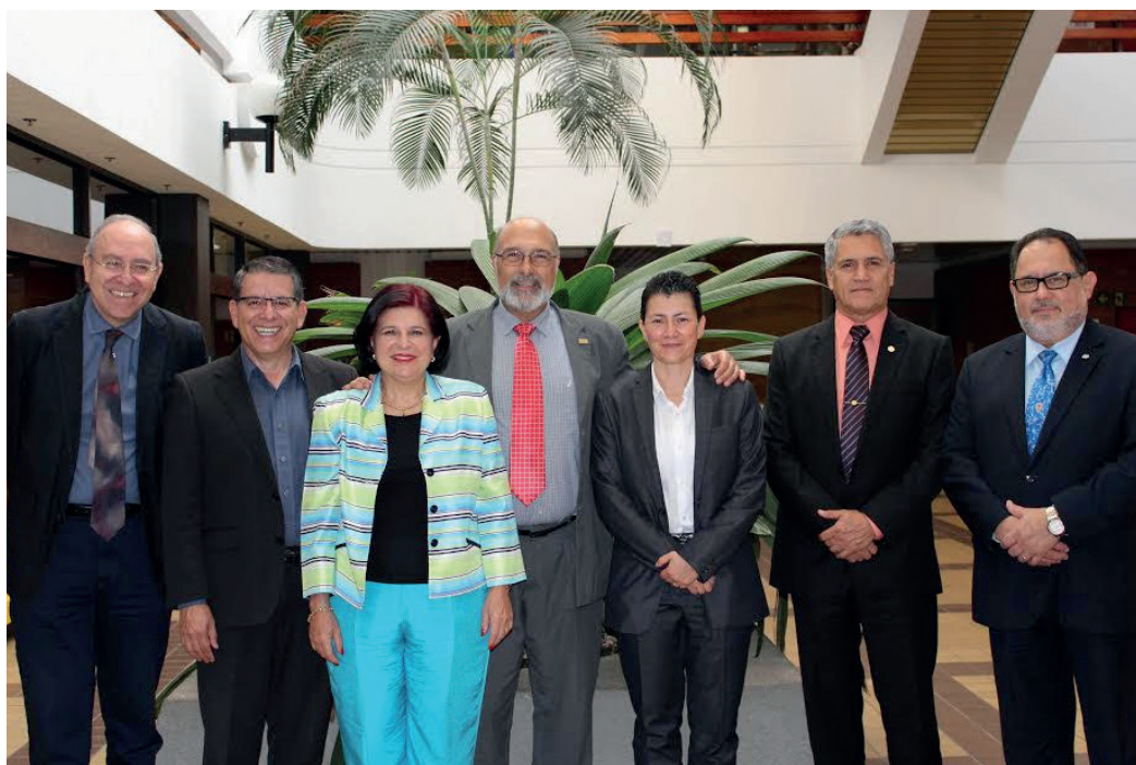
PIE DE FOTO: TRASPASO UNA

Asume la Presidencia del CONARE a partir del 4 de diciembre de 2015 inicia su período de Presidencia en el Consejo Nacional de Rectores y preside la sesión No.38-15 celebrada el 8 de diciembre de 2015.