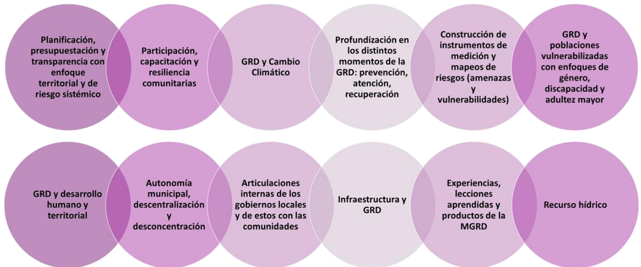
Figura 2. Temáticas deseables para un futuro Encuentro