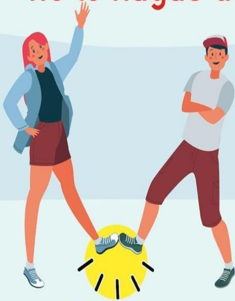
CON EL PIE