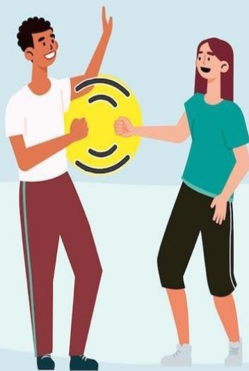
CON EL PUÑO DE LEJOS