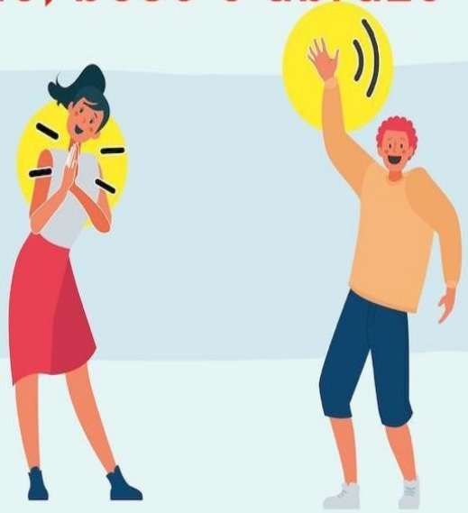
JUNTANDO LAS MANOS