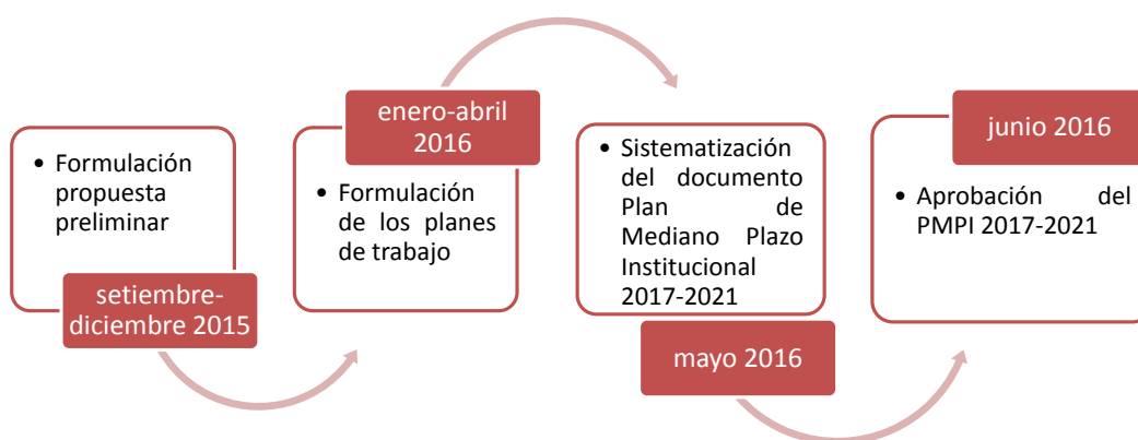
Figura 3 Cronograma de actividades para la formulación y aprobación del PMPI 2017-2021

El proceso de formulación del Plan de Mediano Plazo comprendió las siguientes fechas, de acuerdo con el cronograma propuesto para tal efecto: