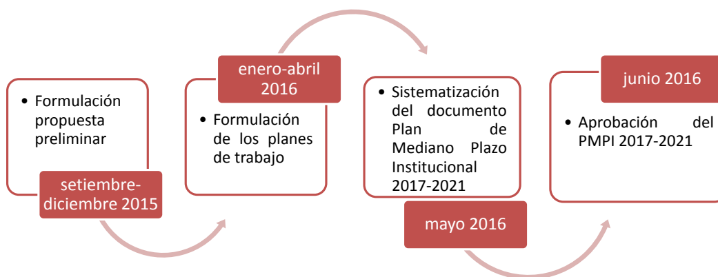
Figura 3 Cronograma de actividades para la formulación y aprobación del PMPI 2017-2021

El proceso de formulación del Plan de Mediano Plazo comprendió las siguientes fechas, de acuerdo con el cronograma propuesto para tal efecto: