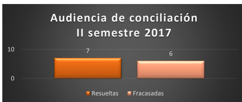
Gráfico No.2. Resultado de las audiencias de conciliación de junio a diciembre de 2017

Los ocho casos que ingresaron para emitir resolución fueron resueltos en su totalidad.