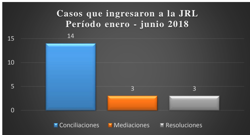
Gráfico No.3. Total de casos que han ingresado de enero a junio 2018

De las 14 audiencias de conciliación realizadas, siete llegaron a un acuerdo, mientras que las siete restantes se dieron por fracasadas (Gráfico 4).