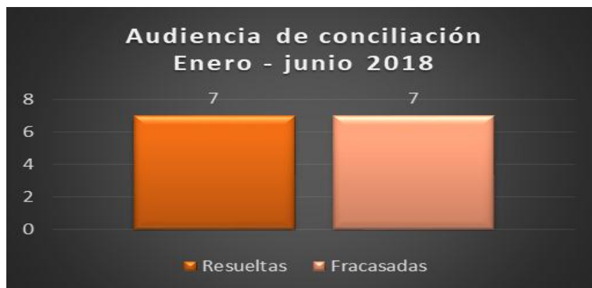
Gráfico No.4. Conciliaciones de enero a junio 2018

De las 14 audiencias de conciliación realizadas, siete llegaron a un acuerdo, mientras que las siete restantes se dieron por fracasadas (Gráfico 4).