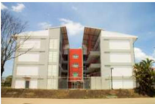
Vista frontal y pasillo del edificio Emprendimiento, educación permanente y Cadena de Abastecimiento y Logística (CAL)

Como ha sido usual no se incluye el rubro de infraestructura porque el edificio correspondiente, que albergará tanto el Programa UNA-Emprendedores, como el Programa UNA-Educación Permanente y la carrera en el ámbito de Abastecimiento y Logística, se financió con recursos institucionales. Inició en abril 2016 y fue entregado, conforme con lo programado, en abril 2017.