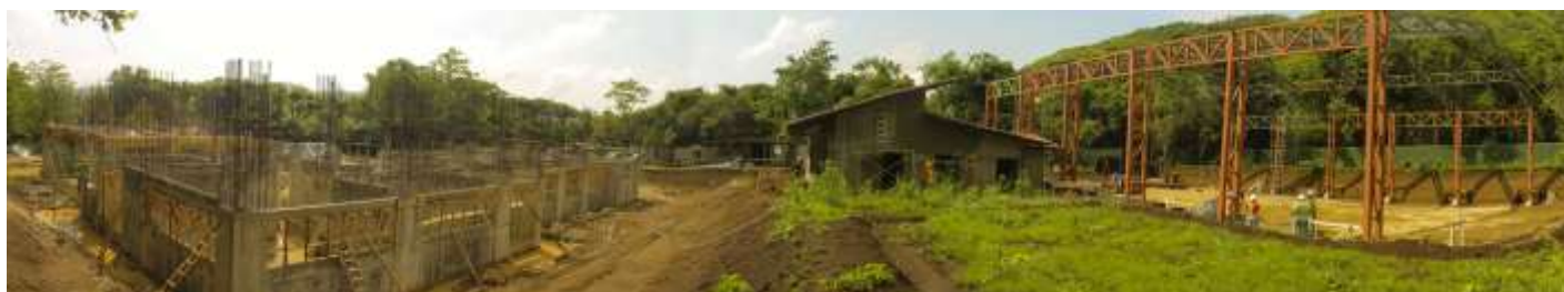
Residencias estudiantiles y obras recreativas Campus Nicoya

En el periodo trabajaron hasta alcanzar el último nivel de las residencias y se alcanzó a finalizar la estructura metálica y a iniciar la colocación de la cubierta de techo de las canchas multiuso que posibilitarán la práctica de cinco disciplinas deportivas. También iniciaron los trabajos en el puente.