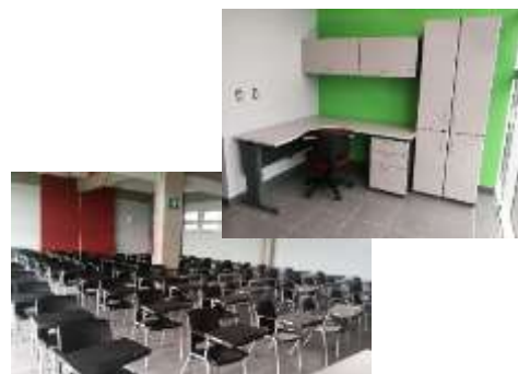
Mobiliario aulas y oficinas CEG

Asimismo, según se lee en el Cuadro 29, se postergó la licitación de amueblamiento de las residencias del Recinto Sarapiquí (por abandono de la obra) y se iniciaron las licitaciones asociadas a la compra de muebles de las residencias de Pérez Zeledón y de Liberia y Nicoya