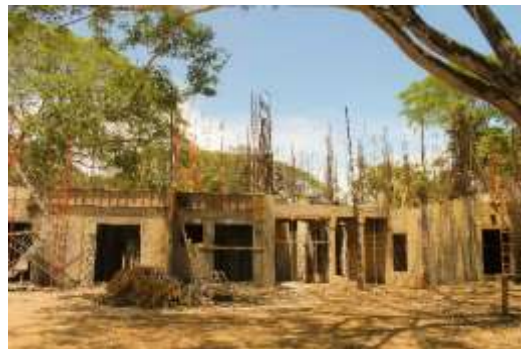
Residencias estudiantiles Campus Liberia

También en este caso el semestre concluyó con el alcance al último nivel de las residencias y con la conclusión de la estructura metálica e inicio de la colocación de la cubierta de techo de las canchas multiuso.