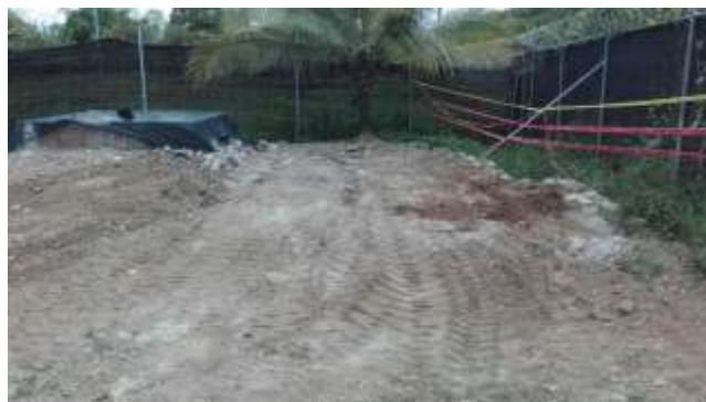
Figura 15. Limpieza de sitio de obras por parte de la empresa constructora en los días previos al abandono del proyecto.