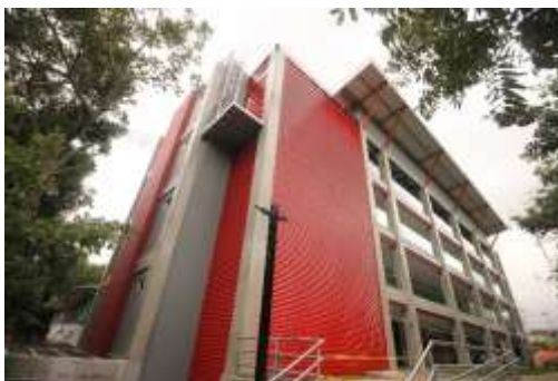
Edificio del Centro de Estudios Generales

En lo que al rubro de mobiliario corresponde el Cuadro 29 muestra que concluyó el proceso de adquisición para amueblar el Centro de Estudios Generales. El mismo fue instalado sin mayores contratiempos antes de la conclusión del semestre quedando pendiente para julio el pago de las facturas correspondientes.