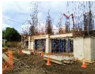
Edificio para la innovación de los aprendizajes y las artes

La obra marcha según lo programado, lo que hace suponer que concluirá en el tiempo establecido. Al 30 de junio para el edificio de innovación de los aprendizajes y las artes se contaba con el entrespiso del segundo nivel debidamente colado, las obras de retención perimetrales finalizadas y se había iniciado la chorroa de columnas para colocar vigas de entrespiso del tercer nivel.